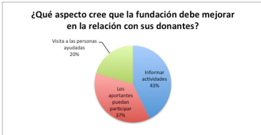
Figura 6. Mejoramiento del servicio.

43% donantes piden que se mejore la manera de informar actividades, esto se relaciona mucho a la pregunta anterior en donde ellos indican que no desconocen lo que la fundación hace con su aportación.