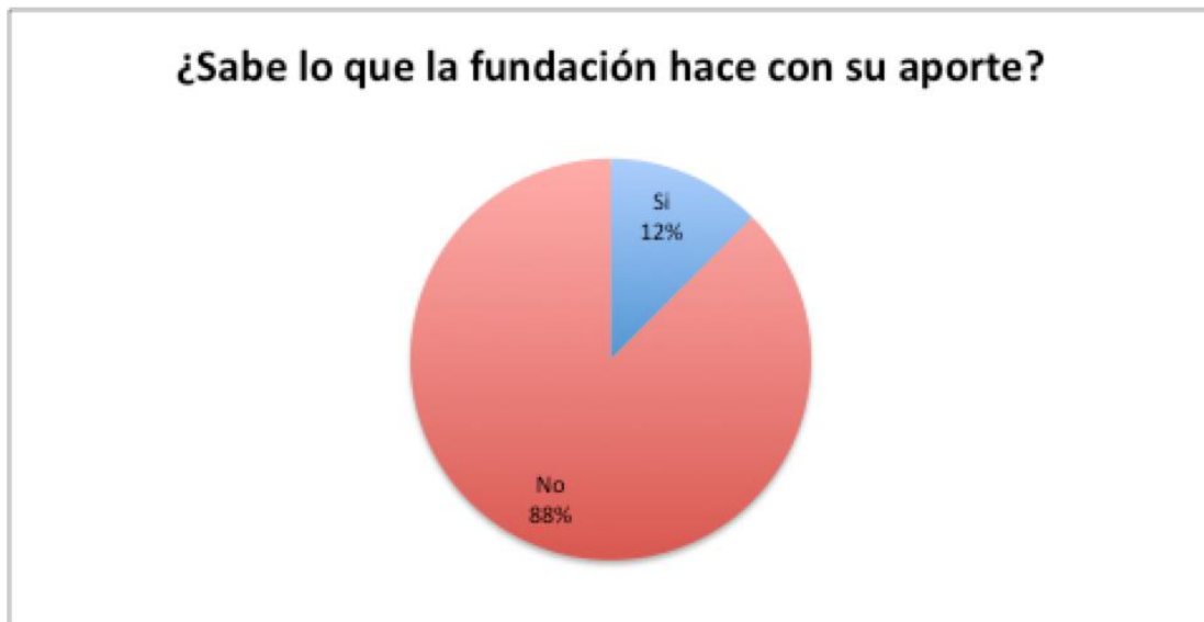
Figura 5. Grado de información de la gestión de la fundación.

Las donares pese a conocer las actividades de la fundación, desconocen que se hace con su aporte en específico. El 88% desconoce a donde va dirigido su dinero y las capacitaciones que se financian. Solo un 12% está consciente de a donde va dirigido su donación.