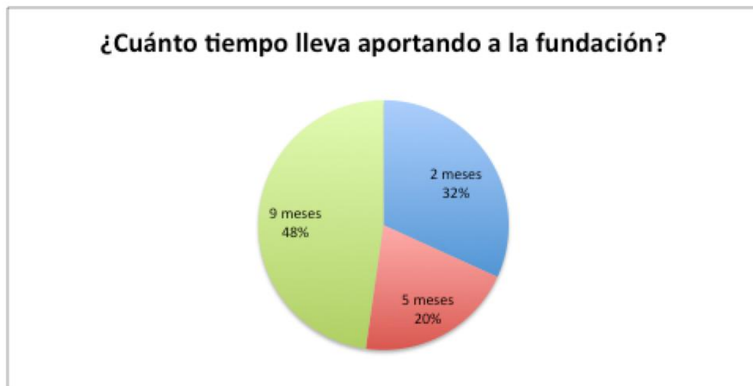
Figura 4. Tiempo de participación en la fundación

El 52% de nuestros donantes recibe las noticias y actividades de la fundación por medio de los correos informativos que se envían de manera semanal, otro grupo de 34% conoce de las actividades por las redes sociales de la organización. En tercer lugar la prensa escrita.