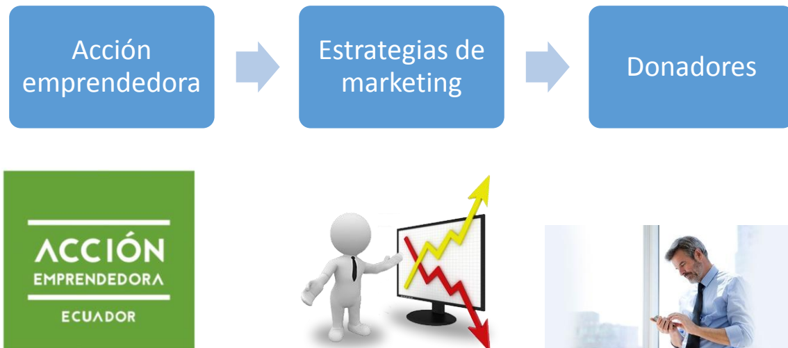
Figura 2. Escenario para análisis

En la figura 2 se muestra el escenario para análisis donde se definen los actores que necesitan ser descritos a fin de luego evaluar las estrategias emprendidas por la fundación, a continuación se detallan los mismos.