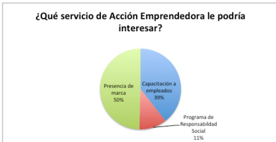
Figura 8. Servicios de la Fundación

Los donantes prefieren tener presencia en redes sociales, donde pueden ser vistos masivamente, un 40% escogió esta opción sobre el 38% de estar en la prensa escrito y un 22% de recibir mail informativos sobre las actividades que realiza la fundación para los microempresarios.