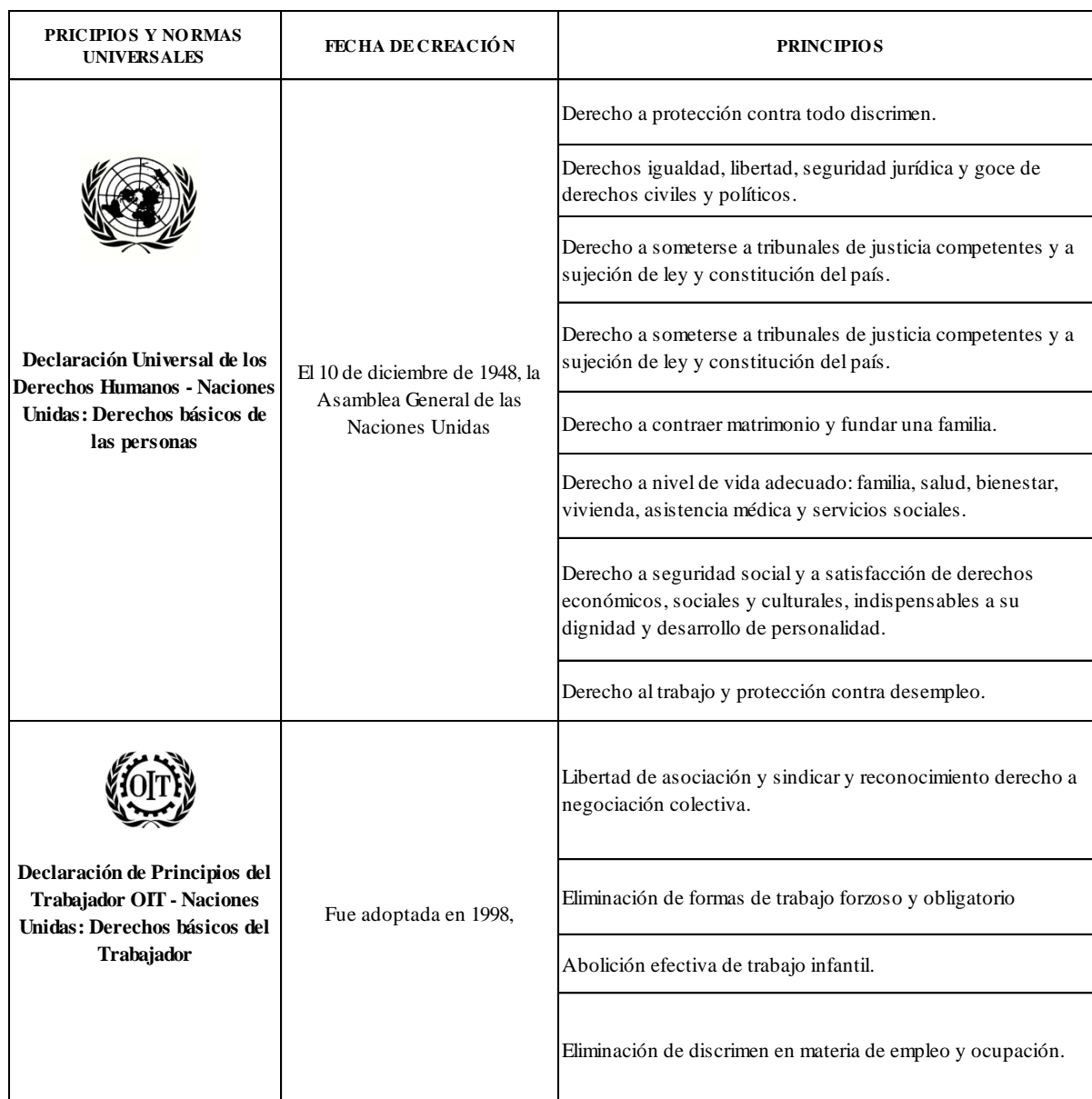
Tabla 1 Principios y Normas Internacionales

Nota: Resumen de la Declaración Universal de los Derechos Humanos - Naciones Unidas: Derechos básicos de las personas y Declaración de Principios del Trabajador OIT - Naciones Unidas: Derechos básicos del Trabajador (ONU, 1948; Organización Internacional del Trabajo, 1998).