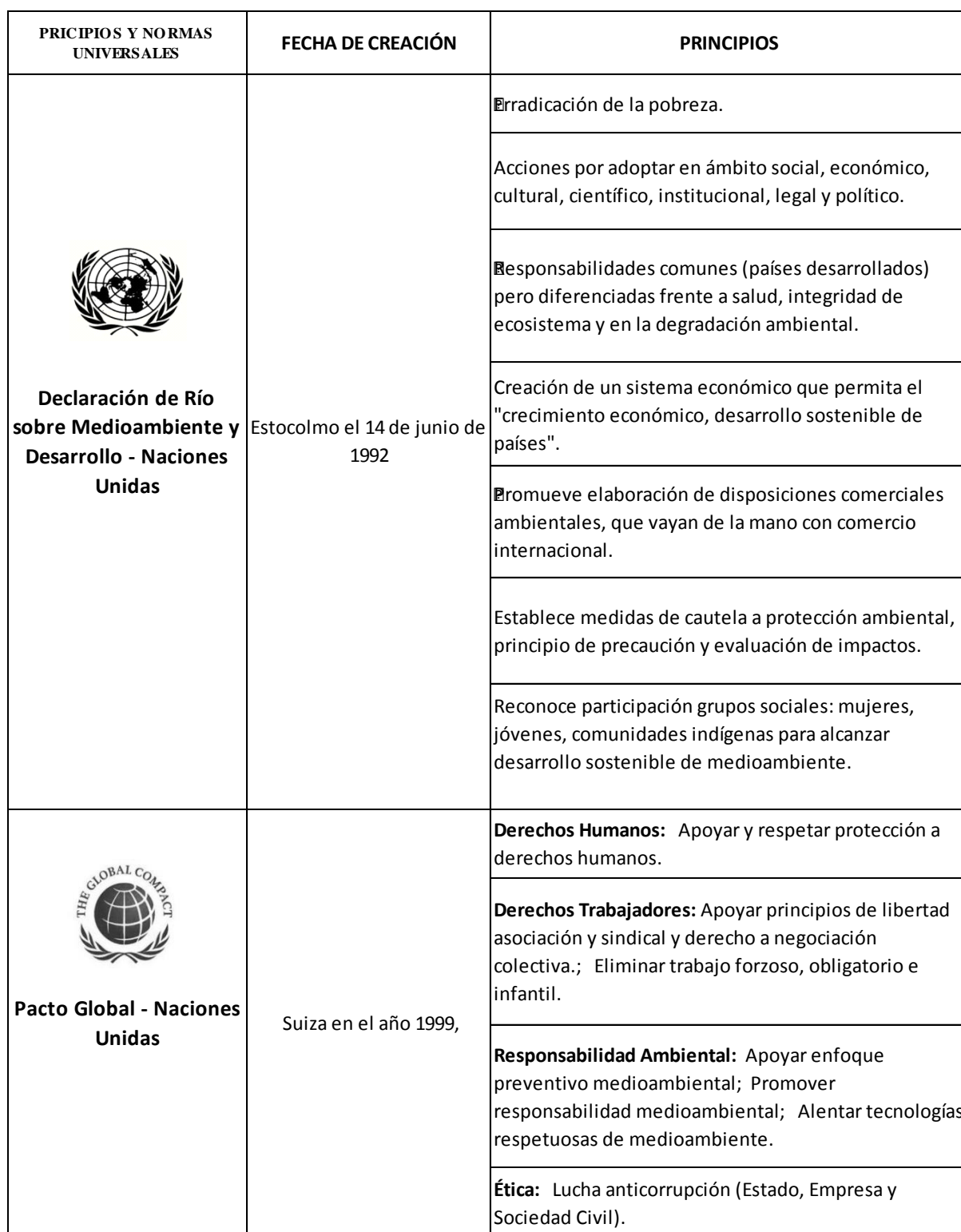
Tabla 2 Principios y Normas Internacionales

Nota: Resumen de Declaración de Río sobre Medioambiente y Desarrollo - Naciones Unidas y Pacto Global - Naciones Unidas (ONU, 1992; United Nations Global Compact, 2007).