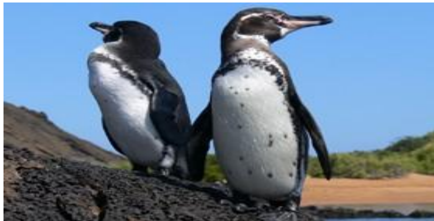
Figura 2. Imagen ilustrativa del Pingüino de Galápagos. Se pueden observar las características físicas del pingüino de Galápagos.

sobre la presencia de depredadores. El Galápagos es el único pingüino capaz de criarse y vivir en un clima completamente tropical y a la vez puede ser encontrado en el hemisferio norte (Elías, Fitter, & Wahlstrom, 2007).