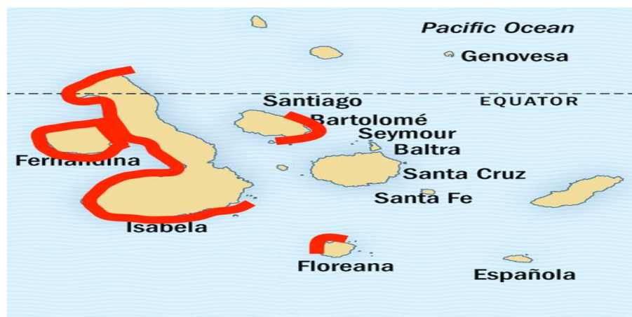
Figura 4. Imagen ilustrativa de la distribución del Pingüino de Galápagos. Los pingüinos se ubican mayormente en la Isla Isabela

Los pingüinos de Galápagos viven en las áreas costeras en donde pueden hacer nido sobre la tierra y a la vez cazar en las zonas exteriores de los mares. Como se sabe, esta especie es de clima tropical; sin embargo, la corriente de Cromwell trae de las zonas heladas, aguas con nutrientes que permiten aportar alimento con mayor abundancia para los pingüinos la mayor parte del tiempo (Elías, Fitter, & Wahlstrom, 2007).