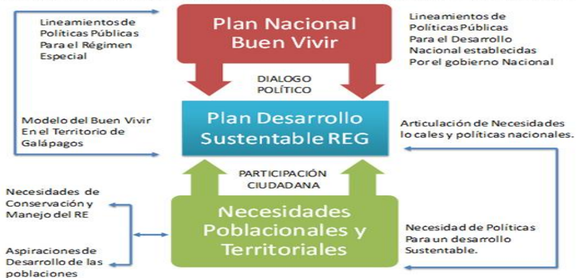
Figura 1. Imagen ilustrativa de la organización política de Galápagos. Se pueden observar los principales planes para el cuidado del archipiélago