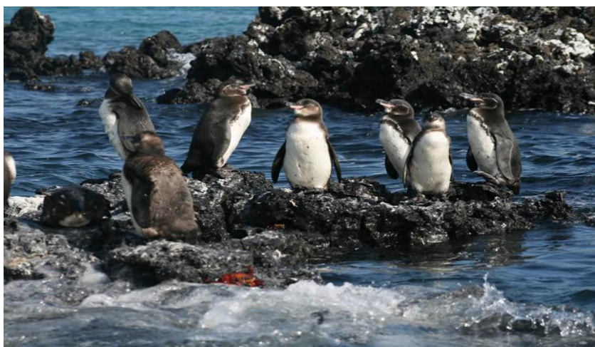
Figura 3. Imagen ilustrativa de la comunicación de los pingüinos. Los pingüinos de Galápagos utilizan sus cuerpos para realizar movimientos para poder comunicarse