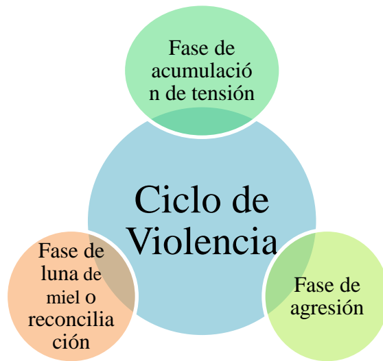
Figura. 2: Ciclo de violencia

Por lo general, el maltrato hacia la mujer suele empezar con conductas de abuso psicológico-verbal por parte de la pareja, difíciles de determinar dado que se encuentran encubiertas por muestras de cariño o violencia pasiva (Yugueros García, 2014). Estas conductas junto a otros componentes tales como, la inmadurez de la pareja, los celos como posesión, la ira o pérdida de control y actitud hostil son indicadores de un alto riesgo de violencia (Echeburúa, 2013). A continuación se identificarán las fases del ciclo de la violencia por medio de una figura.