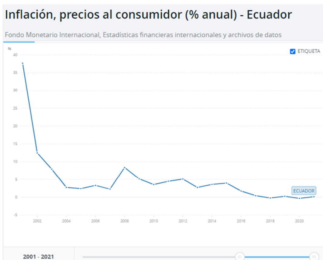
Gráfico 3: Fuente: Banco Mundial. (Banco Mundial, 2023)

Es evidente que la inflación puede traer efectos tanto negativos como positivos a cualquier economía, por lo que, es esencial poner una política de salarios, la cual nos permita la protección de trabajadores con salarios más bajos, con respecto al poder adquisitivo que ellos tienen, con esto garantizamos que la demanda de la economía en conjunto no disminuya, a su vez, esto contribuye en la reducción de la desigualdad salarial.