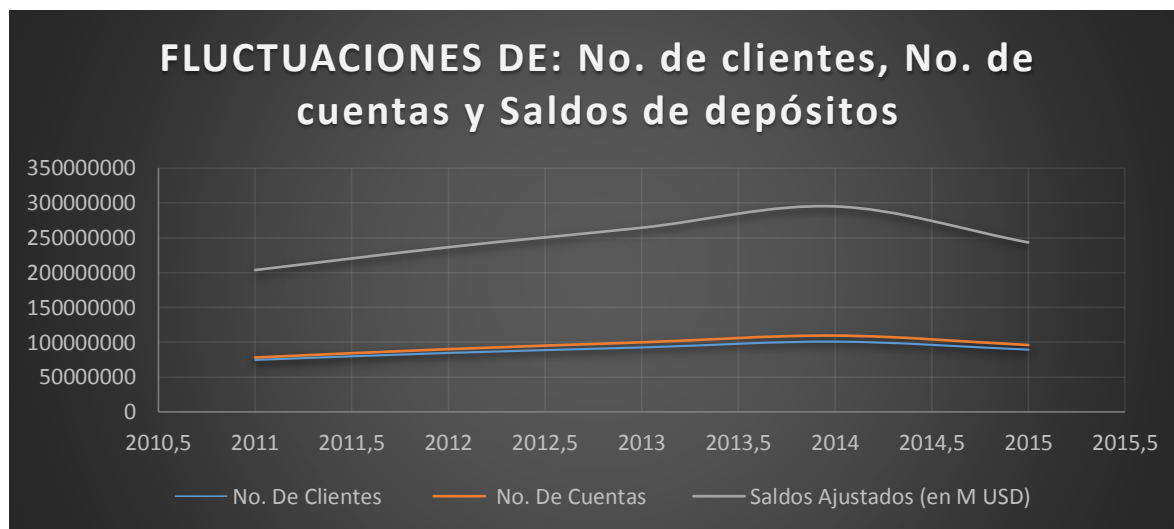
Figura #2: Fluctuaciones de No. De Clientes, No. De Cuentas y Saldos de los depósitos realizados por los bancos privados. Período: 2011–2015*