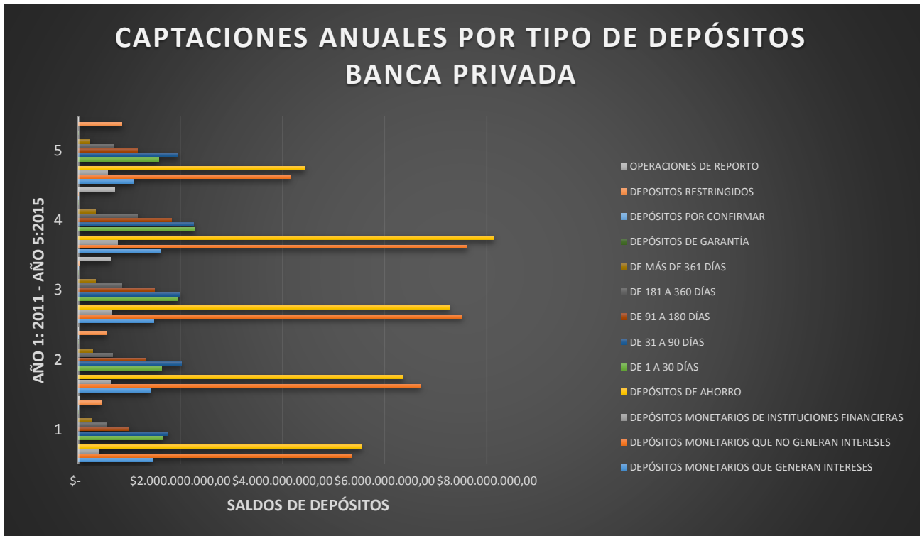
Gráfico #3: Captaciones anuales por tipo de depósitos en la Banca Privada. Período: 2011–2015* Elaborado por: Autor

El gráfico# 3 nos muestra las captaciones anuales por los distintos tipos de depósitos, los mismos que fueron explicados en el marco teórico. Según lo observado, se puede determinar que los mayores porcentajes de los depósitos realizados en cada uno de los años analizados correspondieron a los depósitos de ahorro, seguidos por los depósitos monetarios que no generan intereses, subcuentas que corresponden a la cuenta de depósitos a la vista. En segundo plano se encuentran los depósitos a plazo en donde se muestran más relevantes los realizados de 31 a 90 días y de 91 a 180 días. Le siguen los depósitos restringidos, depósitos de garantía, operaciones de reporto y por último, los depósitos por confirmar.