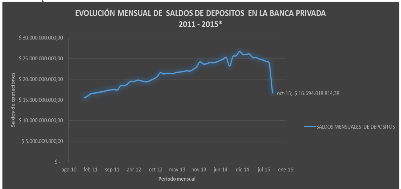
Figura #1: Evolución Mensual de Saldos de Depósitos en la Banca Privada. Período: 2011–2015* Fuente: Superintendencia de Bancos y Seguros Elaborado por: Autor