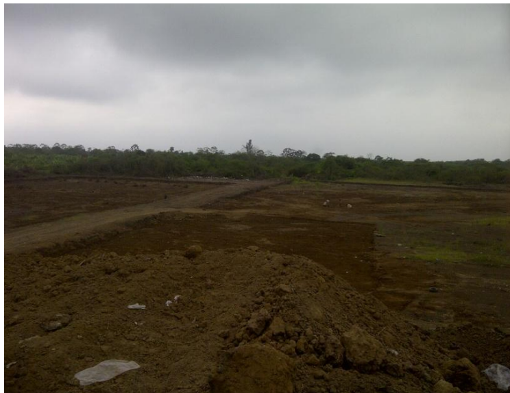
Vista del relleno sanitario