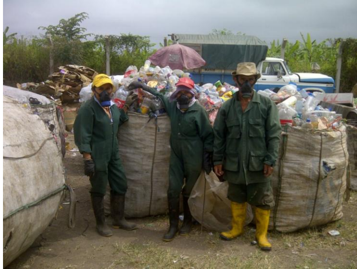
Recicladores del Relleno Sanitario de Machala junto a los productos reciclados, en su mayoría PET.